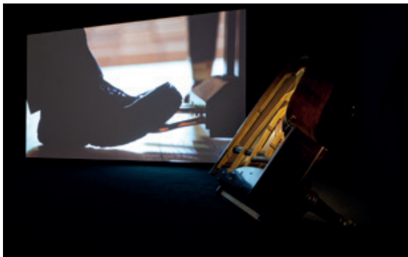
Vue de l'exposition Polyphonies , Centre Pompidou, Paris, 2016. (Œuvres d'Oliver Beer.)

phosé la traversée du tunnel des Tuileries en une descente pariétale au fond de soi-même, aux origines du monde, de la peinture et du cri. Et comme si ces illuminations ne suffisaient pas, le Président poète du Palais de Tokyo a voulu rendre l'architecture à son élégance première, en la vidant et en offrant ses clairières, ses cavernes et ses escaliers aux danses de vie et aux interrogations de mort chorégraphiées par Tino Sehgal. Derrière le rideau de perles blanches (évoquant les globules du sang) du regretté Félix González-Torres, l'autre Tino se livre à des jeux dansés, parlés et chantés, qu'il nomme «situations construites» (Sartre dénommait ainsi ses critiques littéraires), où 300 interprètes, âgés de 8 à 82 ans, interrogent le visiteur sur : qu'est-ce que le progrès? Ou : comment ça marche? La «situation» panique This Variation (créée à la Documenta en 2012), où une quinzaine de danseurs entonnent en cercle, dans le noir total, des «bump, bump, bump, bump ba da» qui sonnent comme de la musique électronique, renvoie, de manière surprenante, aux nouvelles écoutes proposées par Beer ou Moultaqa. En replaçant le corps et la voix au centre, tous trois cherchent, comme Michel Houellebecq, à «rester vivant». Hey! ■