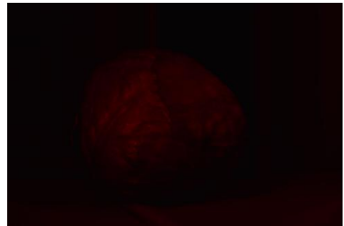
Shamash, le Soleil, dieu de la Justice