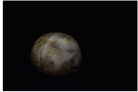
Sin-Lune, astre principal qui éclaire la nuit