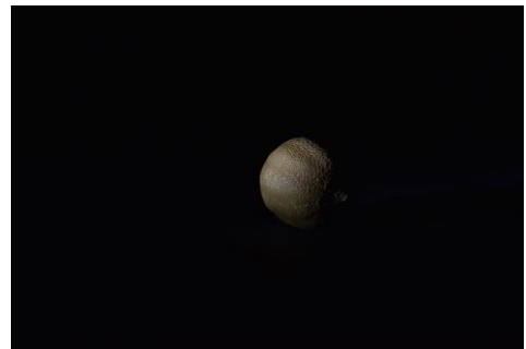
Nabû, prophète, dieu du savoir et de l'écriture