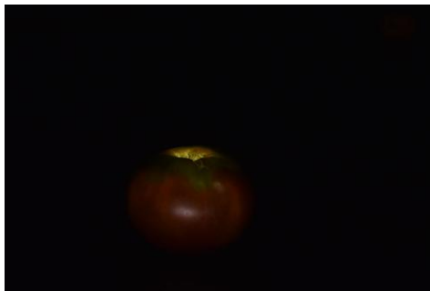
Nergal, dieu de l'enfer