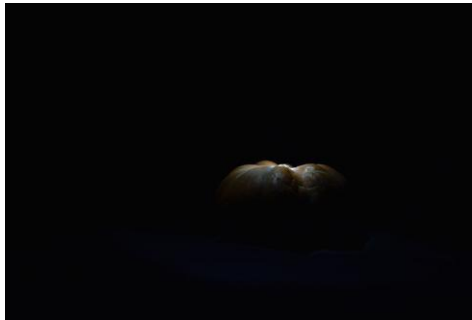
Marduk, dieu suprême