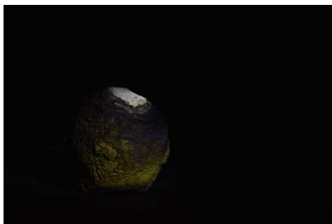
Nin-Urta, divinité guerrière et de la fertilité